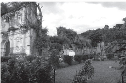
Figura 2. Año 2017- Es notorio el abandono total del inmueble.