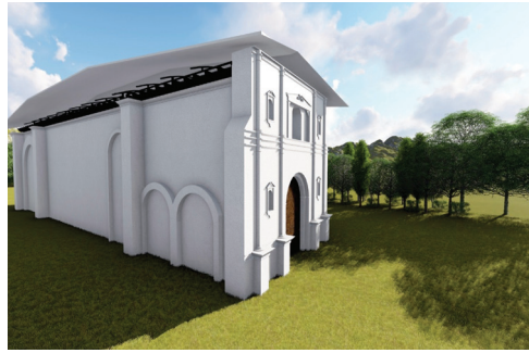
Figura 1. Año 1991- Es evidente el abandono total del inmueble.

Dentro de la propuesta de restauración, también crear programas culturales de actividades varias, gestionado la participación de niños, jóvenes y adultos, por medio de talleres participativos. Esto para promover un sistema cultural a través de la historia del lugar. Estos programas serán de ayuda económica para el sostenimiento de la infraestructura del monumento.