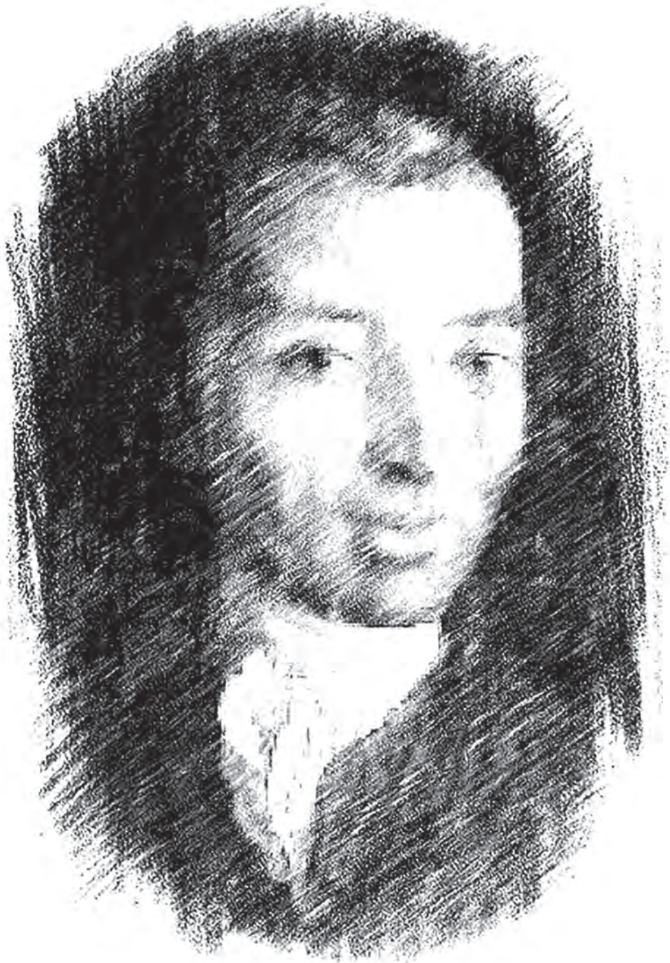
Ilustración: Marcos Ibáñez, boceto digital a partir de la pintura de D. Mariano Maella Pintor del Rey. en: http://www.patrimonioculturaldearagon.es/bienes-culturales/retrato-marcos-ibanez-mariano-salvador-maella-iglesia-san-batolome-odon