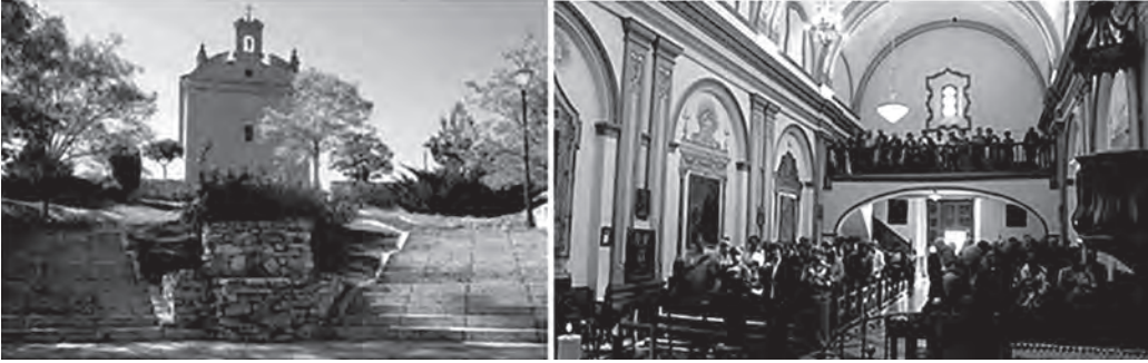
Figura No. 2 Ermita de la Virgen de las Mercedes o de la Cuesta, diseñada por Marcos Ibáñez. Camio de color y diagramación kch. Noviembre 2015

En la parte de atrás de este mismo documento se indica que el 16 de octubre de 1783, unos pocos días antes de marcharse de vuelta a España, vendió su casa a Don Diego Peinado, en 5550 pesos, pagando de su cuenta, el costo de la escritura y alcabala que fue de 223 pesos. 7 Asunto por el cual la casa de Ibáñez pasa a manos de Peinado quien murió en 1789, seis años después.