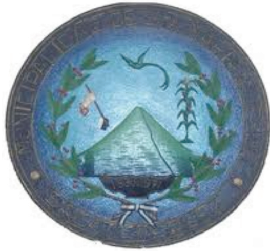
Imagen no. 1: Escudo del Pueblo de Santa María de Jesús.

Del texto se extrae que las condiciones en el volcán se conjugaron para producir hielo, y no tanto nieve, además se puede determinar la cantidad de hielo que en esa ocasión había en