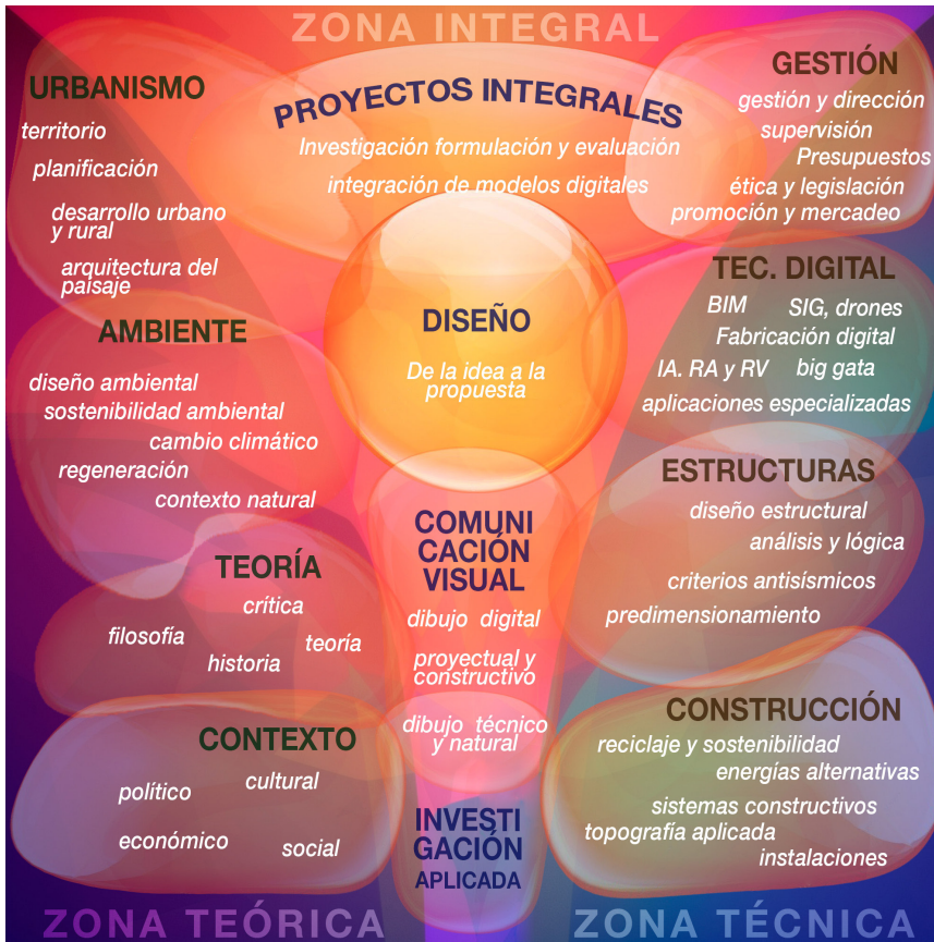
Figura 1: Modelo de currículo integral. Elaboración propia con base en el análisis de distintos planes de estudio de la licenciatura de arquitectura de la USAC.

El modelo de currículo integral de la carrera debe constituirse en un aporte relevante, congruente con los escenarios en la pospandemia, para formar profesionales: