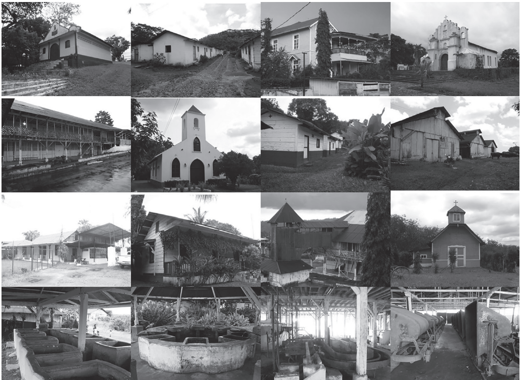
Figura 1. Tomas propias en junio del año 2,014. Las imágenes muestran la arquitectura de las seis fincas cafetaleras visitadas en la Zona Sur Occidental del País: Finca Buenos Aires, Finca Aurora Xolhuitz, Finca Candelaria Xolhuitz, Finca San Antonio Morazán, Finca Rosario-Quezada, Finca San Francisco Miramar. Obsérvese la diversidad y originalidad espacial, así como la utilización de diferentes tipologías arquitectónicas, con materiales y sistemas constructivos muy particulares y novedosos para la época de construcción.

tudes y anchos considerables para la época); así como tampoco se había tenido la necesidad de construir pequeños núcleos urbanos para la convivencia de los propietarios y los trabajadores de las fincas, supliendo necesidades de escuela, habitación, iglesia, tiendas, mercados, entre otros, dentro de las instalaciones de una misma finca de producción cafetalera. Por tanto, a nivel estructural, la infraestructura también presenta aspectos novedosos para la historia de la arquitectura guatemalteca.