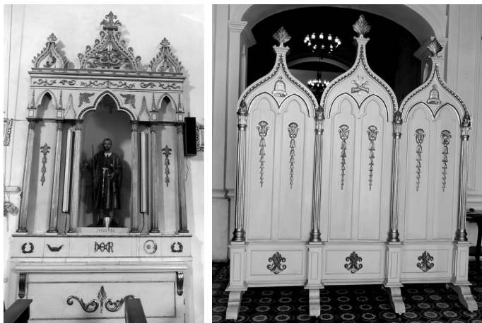
Figura 3 Retablo lateral y cancel de la iglesia del hospital del Hermano Pedro, La Antigua Guatemala

A mediados del siglo XX, se da una significativa importación de retablos fabricados en España y traídos a Guatemala para ocupar los espacios testeros de las iglesias de los principales conventos de la ciudad capital. Entre ellos podemos mencionar el retablo mayor de la iglesia de la Merced que fue traído en el año de 1958. 3 Se trata de un retablo ecléctico con columnas entorchadas en el primer cuerpo y remates conopiales. En 1960, 4 el retablo mayor de la Basílica del Rosario (Santo Domingo), dorado, de gusto clásico y en 1965, el de la iglesia de San Francisco, elaborado por José Nicolás Almanza, también de gusto neoclásico, de madera, sin ningún acabado, con relieves de la vida de San Francisco y al centro una escultura del santo seráfico abrazando a Cristo en la Cruz, inspirado en la pintura de Murillo (c.1668) del mismo tema. 5