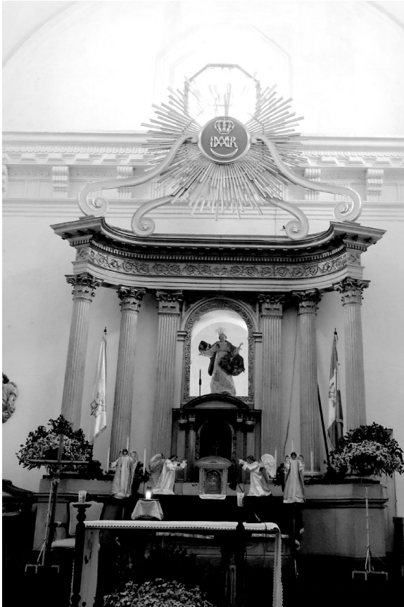
Figura 2 Retablo mayor de la iglesia de Jocotenango, Sacatepéquez.