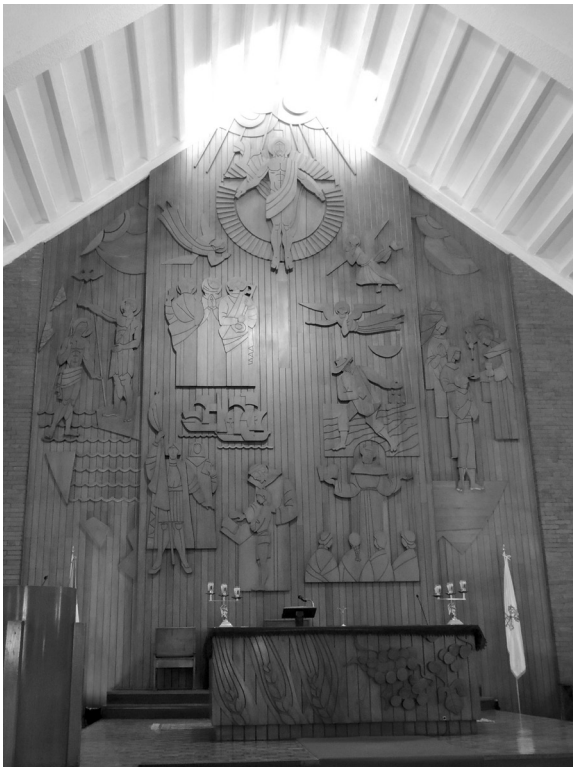
Figura 6 Retablo mayor de la iglesia de la Villa de Guadalupe, obra Roberto González Goyri de 1986.

Otro retablo cubista es el de la Iglesia Inmaculado Corazón de María, en la zona 12, que también tiene tres calles, sin cuerpos. Al Centro aparece la figura de Jesucristo resucitado y a los lados escenas de frailes franciscanos evangelizando a pobladores del interior del país. Al lado izquierdo también aparece una figura de la Virgen de Guadalupe. Todas estas figuras son de relieve de madera en su color. La iglesia también posee dos retablos laterales cubistas con escenas del sol, los planetas y la naturaleza, uno destinado a albergar la imagen de la Virgen de Fátima y otro para el Santísimo Sacramento.