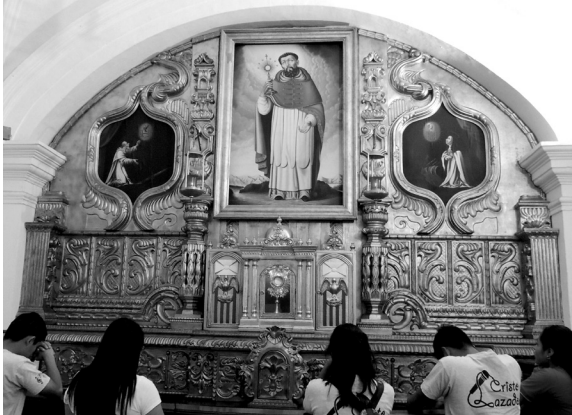
Figura 4 Retablo de la Capilla del Santísimo, Iglesia de la Merced, La Antigua Guatemala.

guatemalteca. 2) El retablo mayor de la Catedral de Santa Cruz del Quiché fue inaugurado en el año 2008, 9 es un retablo salomónico con policromía que combina el dorado y el color rojo. 3) El retablo de la capilla del Santísimo Sacramento de la iglesia de la Merced en La Antigua Guatemala, es una réplica simplificada del retablo de San Judas Tadeo de la iglesia mercedaria del Centro Histórico de la ciudad capital.