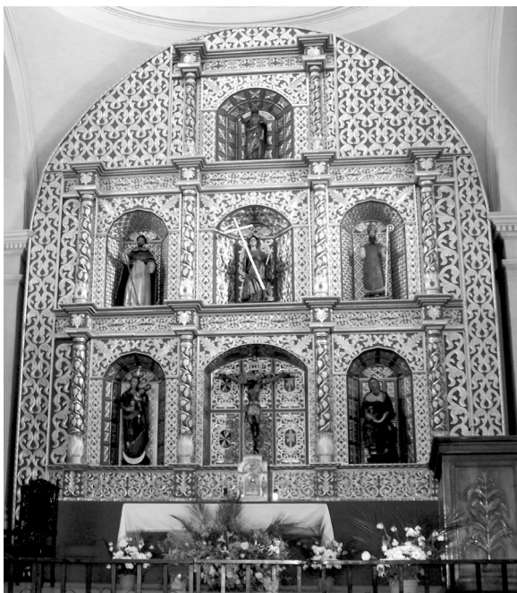
Figura 5 Retablo mayor de la catedral de Santa Cruz del Quiché, 2008.